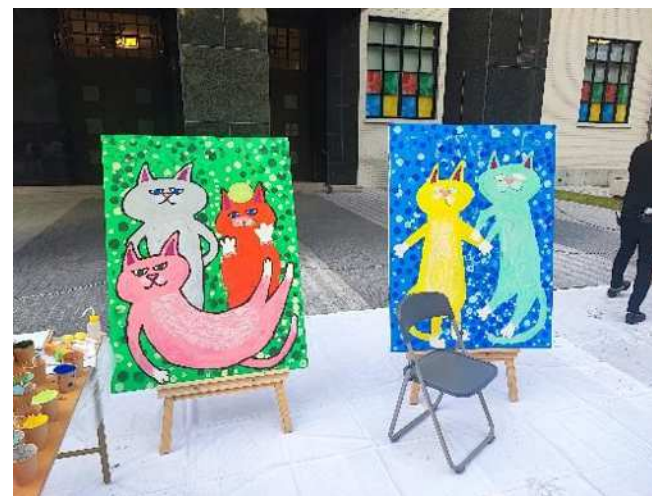
子どもたちに背景のスタンプを押してもらい、アート作品を作成している様子