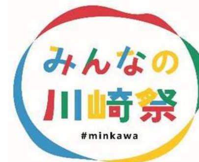
みんなの川崎祭ロゴマーク

当日、当初は曇り空でしたが次第に晴れ、同日開催の「かわさき市民祭り」との相乗効果もあり、約40,000人の方々に御来場いただきました。