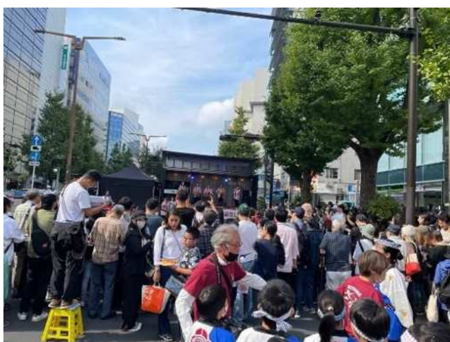
コミュニティステージのステージを見守る観客の皆さん