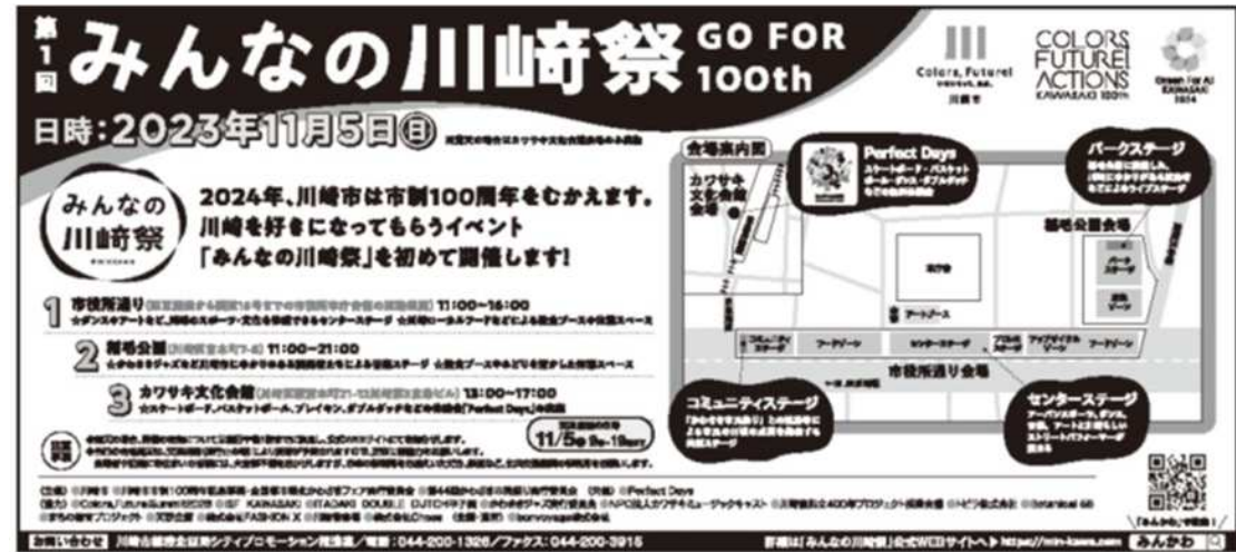
10/28付 神奈川新聞段広告