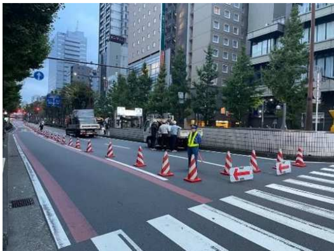
砂子交差点の様子