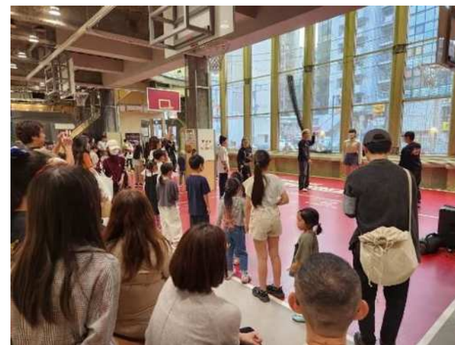
フリースロー、プレイキン、スケボー、ダブルダッチの体験会の様子