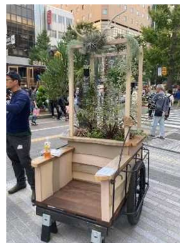
株式会社みつや園様などによるみどりの展示