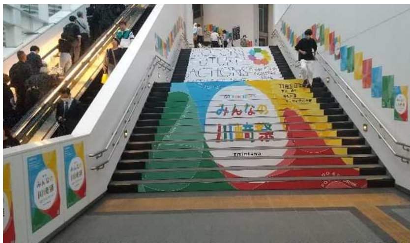
10/12～ JR川崎駅北口通路で広報を展開