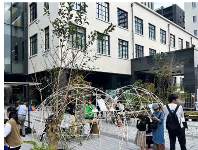
ブースのドームの様子