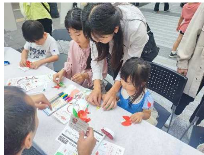
お花のペーパークラフト体験の様子