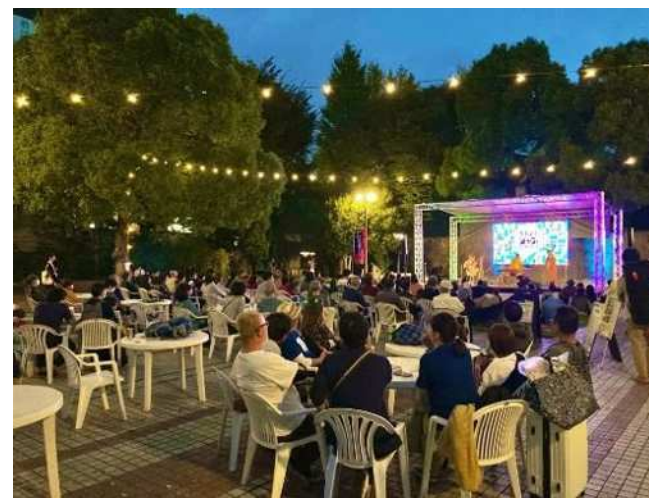
ゆったりと「かわさきジャズ」を聴くパークステージの様子