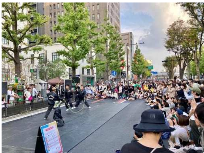
センターステージでダブルダッチ