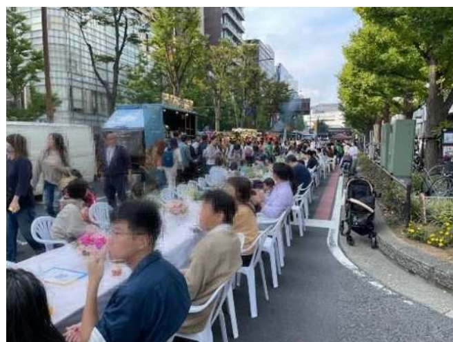
キッチンカーとロングテーブルで飲食する様子