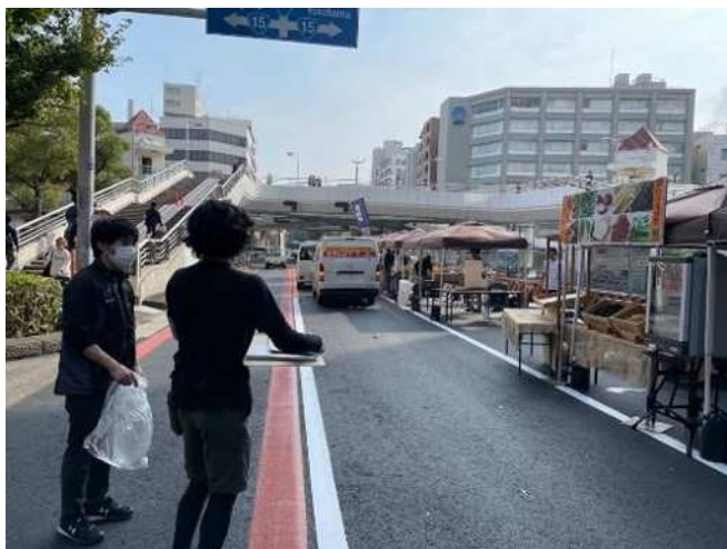
稲毛公園前の様子