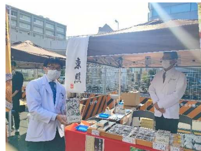
ホテル縁道様発案による川崎フードゾーンの開設（株式会社岩田屋様、株式会社東照様等も出店）