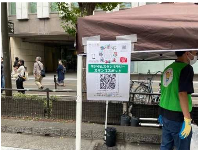
「Colors Future! Summit」デジタルスタンプラリースポット