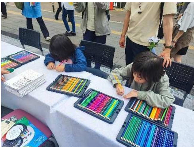
タイルアートの材料とする紙片に色を塗る様子

● 100周年・緑化フェアブースでは、100周年や緑化フェアの周知を実施しました。