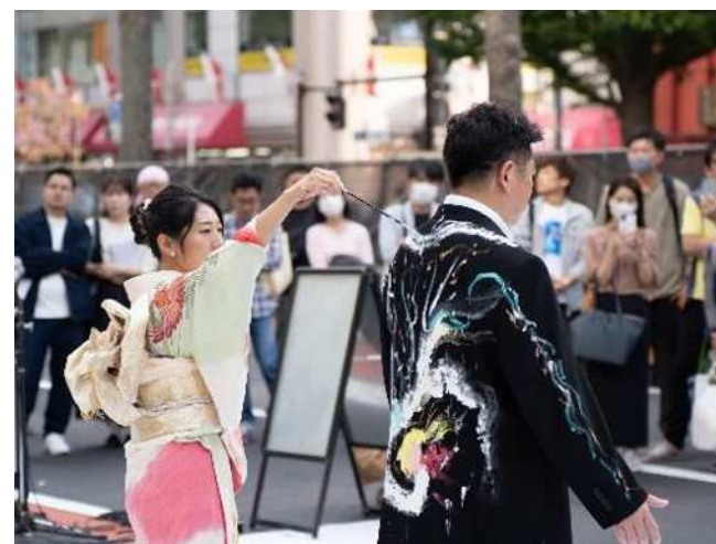
センターステージで市長の上着にライブアート