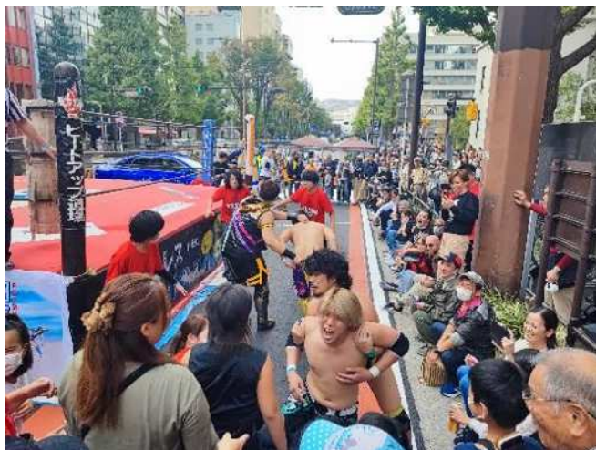
プロレスリング・ヒートアップ株式会社様による路上でプロレスステージ

昨年度募集した「アイデアの種」を参考にお声がけし、一緒にイベントを盛り上げました。