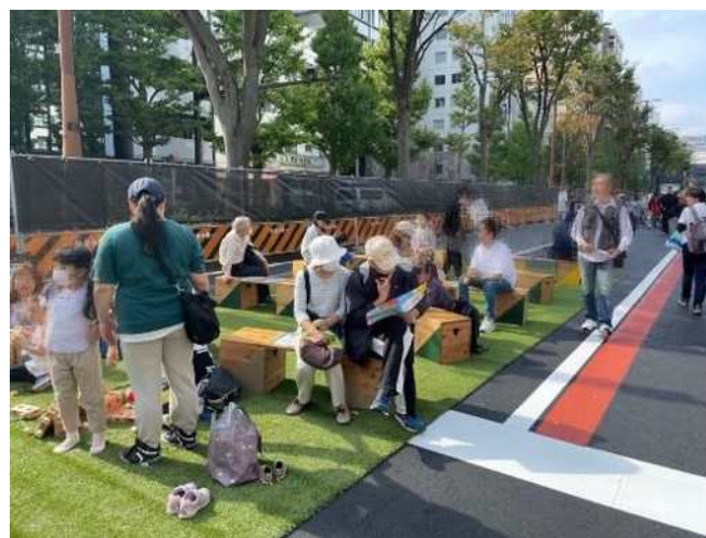
子どもが遊べてみどりを感じる休憩スペース